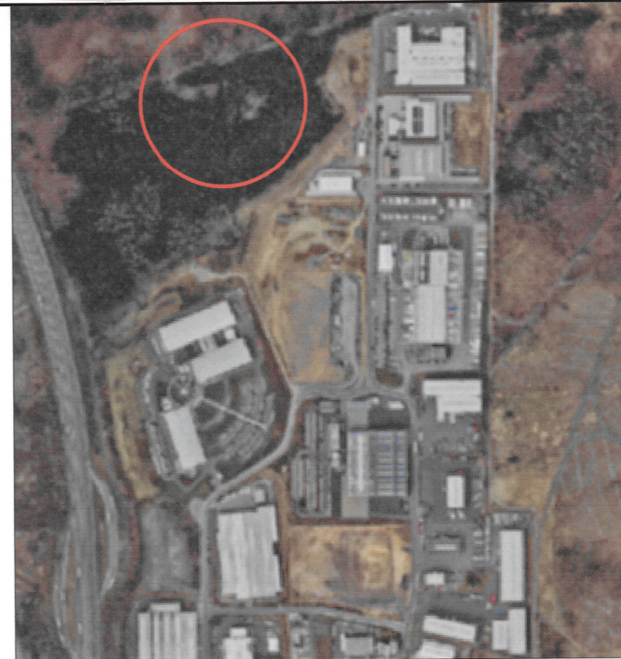
Übersichtsplan - ohne Maßstab